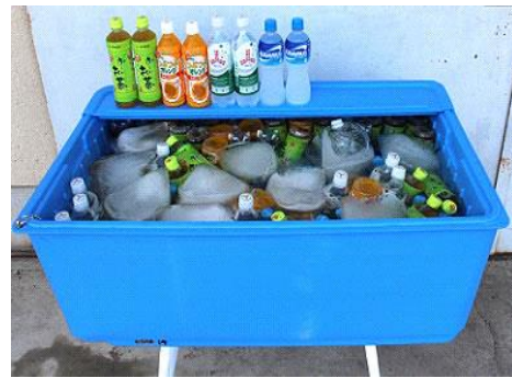
ドリンク冷却ボックス