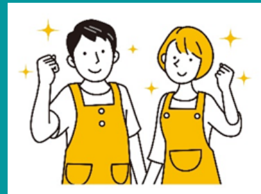
○支えあい活動の推進